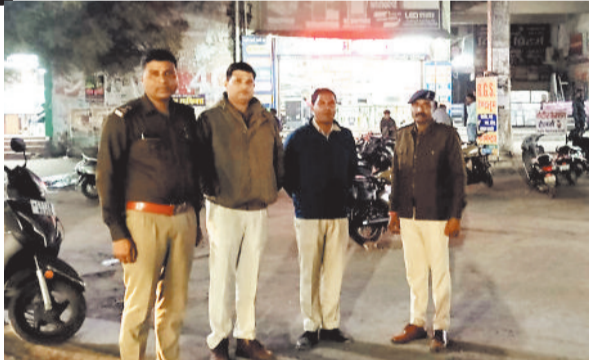
टी बार में कार्रवाई करती पुलिस।

लाईन थाना क्षेत्र अंतर्गत शहर के संवेदनशील एवं अड्डेबाजी वाले क्षेत्र घंटाघर तिराहा टीबार के पास पुलिस द्वारा एमसीपी (मोबाइल चेकिंग पोइंट) लगाकर विशेष चेकिंग अभियान चलाया गया। अभियान का उद्देश्य असांजिक तत्वों पर अंकुश लगाना, यातायात