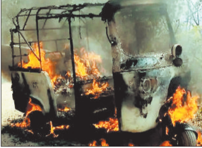
धुं धुंकर जलता आँटों।