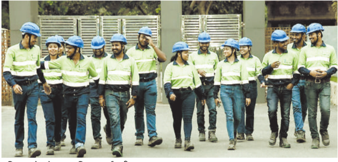
प्रशिक्षण के दौरान उपस्थित कर्मचारियों।

बालको ने विस्तार परियोजना, आधुनिक तकनीक और कौशल विकास में लगातार निवेश किया है। इससे इंजीनियरिंग, प्रचालन, रखरखाव, सुरक्षा, प्रशासन, सामुदायिक विकास और अन्य क्षेत्रों में अच्छे रोजगार के अवसर बने हैं। इससे स्थानीय प्रतिभाओं को राज्य से बाहर जाए बिना ही बड़े और वैश्विक स्तर के काम करने का मौका मिल रहा है।