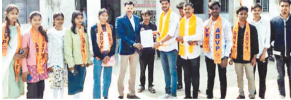
ज्ञापन सौंपते एबीवीपी के कार्यकर्ता।

डामर फैक्ट्री से उठने वाला धुआं बॉयस होस्टल एवं गर्ल्स होस्टल तक पहुंच रहा है। इसके