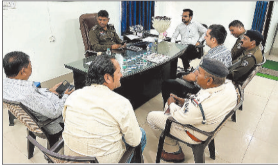
कोतवाली में बैठक लेते पुलिस अधिकारी।